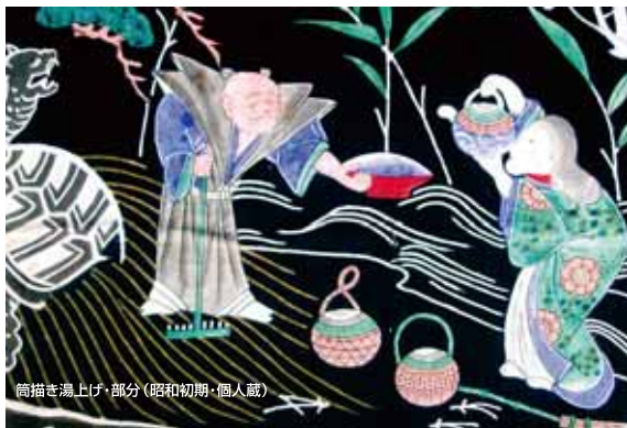
筒描き湯上げ部分(昭和初期・個人蔵)